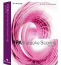
PPA Karaoke Scoring Let Sing and Score!!